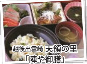
越後出雲崎 天領の里 「陣や御膳」