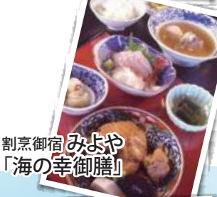
割烹御宿 みよや 「海の幸御膳」