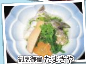
割烹御宿 たまきや 「お泊り1泊2食」