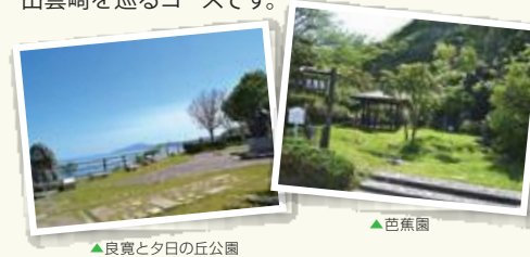
▲良寛と夕日の丘公園

良寛生誕の地であり、芭蕉詠嘆の地。良寛と芭蕉を中心に歴史浪漫あふれる出雲崎を巡るコースです。