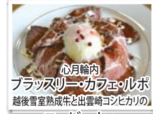
心月輪内 ブラスリー・カフェ・ルポ 越後雪室熟成牛と出雲崎コシヒカリの ロービーdon